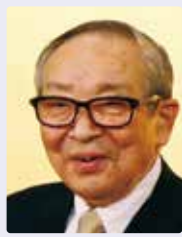
社会福祉法人ユーカリ優都会 理事長

高齢者とそのご家族が安心して住み続けられる街であるために、これからもチャレンジ精神を持って地域の皆様とともにより一層福祉の充実を図ってまいります。